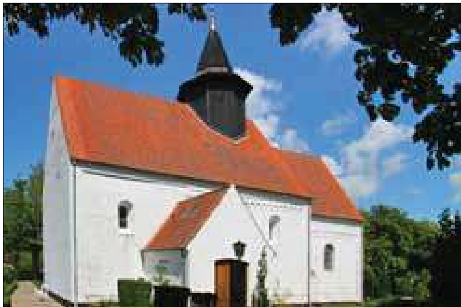
Øster Ulslev Kirke.