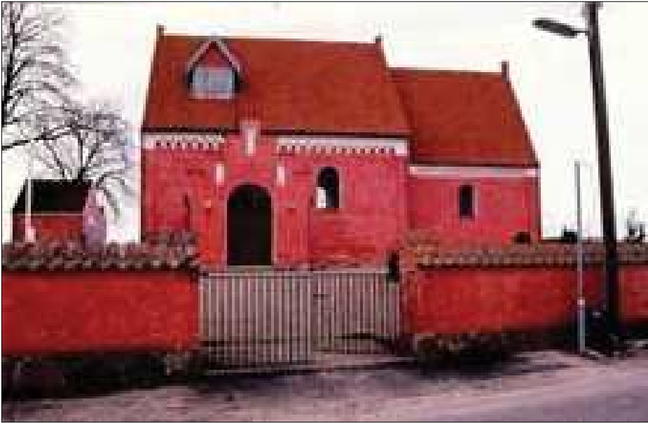
Godsted Kirke.

gelium, ikke har nogen åndelig ret inden for vor kirke' 4 .