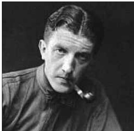
Digteren Nis Petersen

’I en by i Midtjylland bekendtgøres møder i missionshuset med den forsigtige tilføjelse: Om Gud vil! Men når de samme mennesker sætter bekendtgørelser i avisen om møder i politiske og faglige foreninger, savnes denne tilføjelse. Guds bistand synes at være sikret på forhånd til et møde i en mejeriforening; men når det drejer sig om mission i Sudan?! ... Deo volente! 35 Hvor misbrugt – og hvor alt for lidt brugt!’