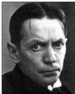
Dramatikeren Kaj Munk

Dette til trods var han altid, men det kun grundet sin ultrakonservative natur, stærkt bundet til alle kirkens oldgamle dogmer, men igen! Ikke uden at tvivle på deres relevans. Netop tvivlen nagede ham: 'Over for påskemorgen, dér har jeg den krasse tro, at enten er Kristus opstanden med legeme og det hele, eller også er det løgn'. (Nationaltidende 7. december 1940). 'Eller også er det løgn'!